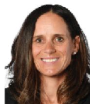
Mme Katerina NASH (CZE)

Président de l'Union Européenne de Cyclisme (UEC)